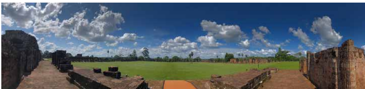
Vista panorámica de la plaza central, desde la entrada de la Iglesia, Trinidad de Paraná. 2019