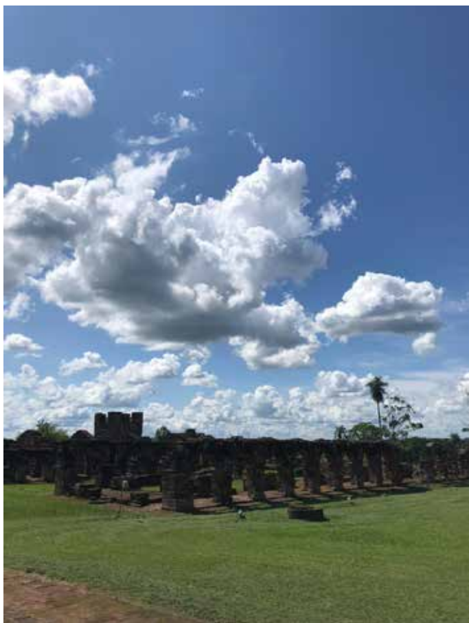
Plaza central, en las zonas laterales entre la Iglesia y la entrada, se ubicaban las casas de los guaraníes. 2019