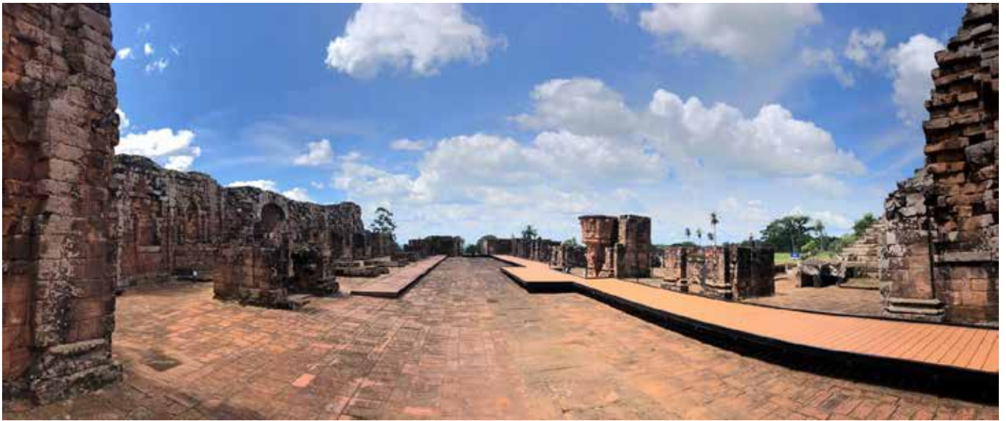
Desde el fondo de la nave, hacia la plaza principal. 2019