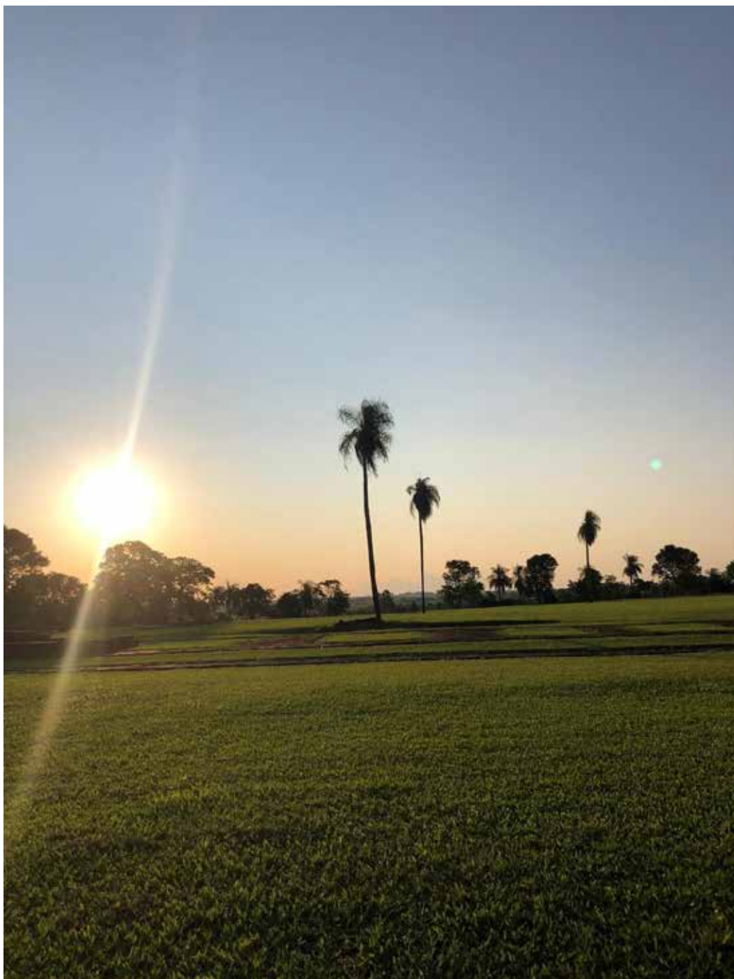
Sol y luna, misión de Jesús de Tavarengué. 2019