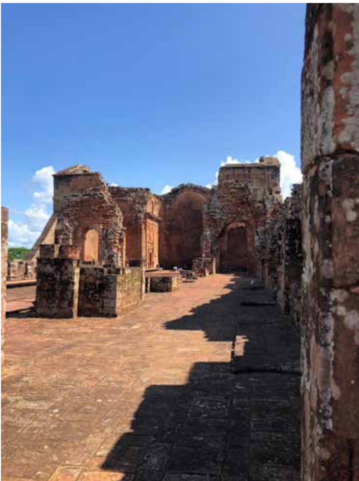
Nave de la iglesia de la reducción de la Santísima Trinidad de Paraná. 2019

Fundadas en la época tardía de la colonia y de hecho dejadas al abandono tras la expulsión de los jesuitas de la región en 1767, ambas reducciones forman parte del patrimonio del UNESCO desde el año 1993. Sin embargo, son muy pocos los turistas y viajeros que llegan a visitarlas al año, por lo cual se encuentran tras el trabajo de restauración y conservación iniciado desde mediados de los años ochenta, en muy buen estado. La reducción de Trinidad llegó a tener una población de 4000 personas guaraníes organizadas en la producción de metales y más especialmente de campanas. La iglesia, cuyas ruinas se pueden observar en las siguientes fotos, se derrumbó en el primer intento de edificación, por lo cual se quedó solo tres años funcional antes de la expulsión de los jesuitas. Tras una visita guiada que recontextualizó su fundación y particularidad, pudimos quedarnos solas y sacar fotos de los detalles arquitectónicos de ambos sitios.