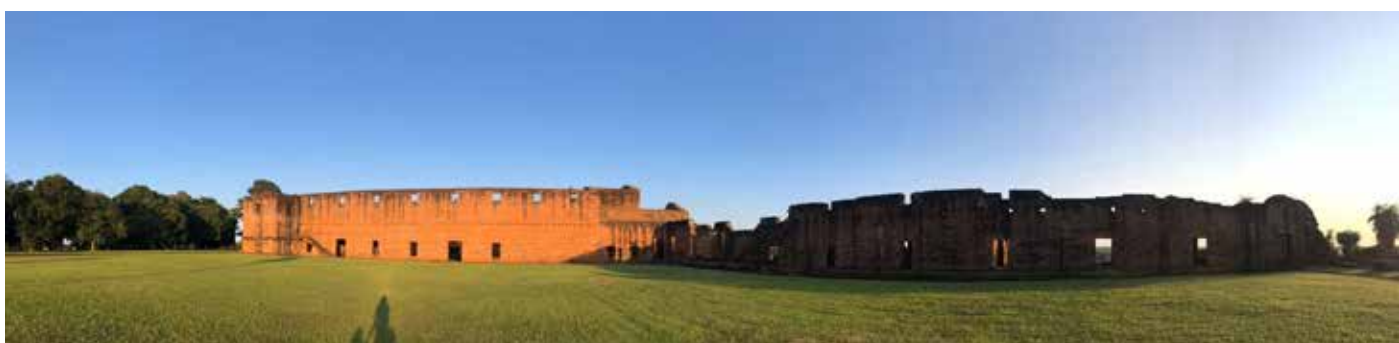
Vista panorámica de Jesus de Tavarengué. 2019