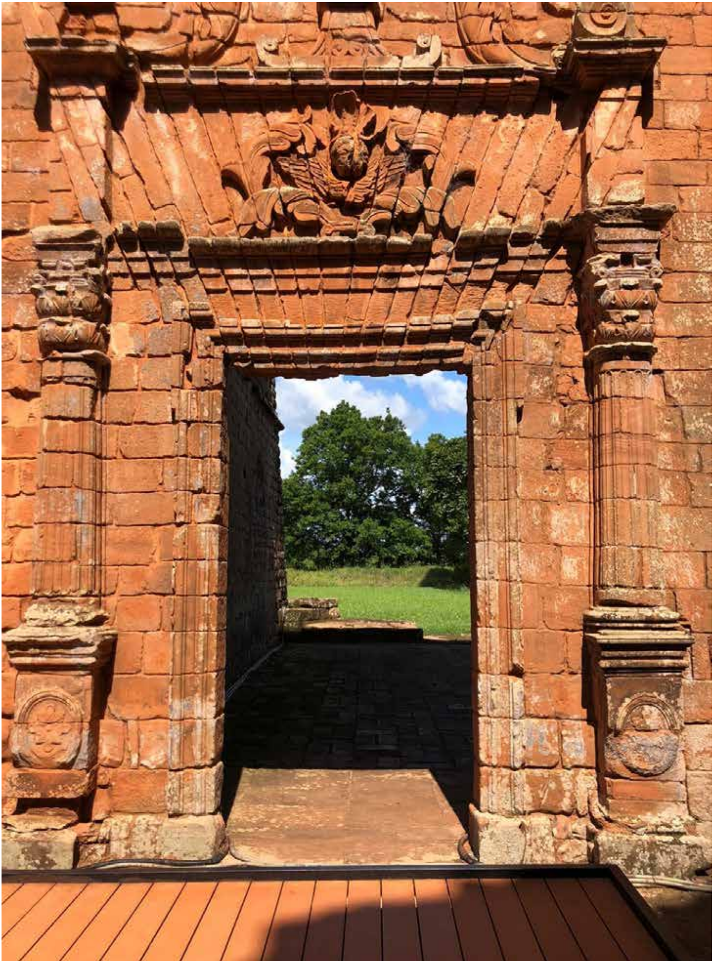
Puerta lateral, hacia la plaza donde se ubicaban los talleres. 2019