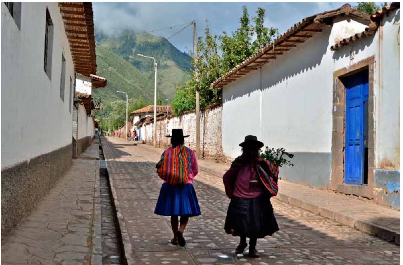
Altiplano/Peru, April 2015.

Los gobiernos neoextractivistas progresistas mencionados comenzaron su despliegue con la revolución bolivariana de Hugo Chávez (1999) en Venezuela y se trazaron por objetivo (en sus comienzos) cuestionar y modificar el proceso de acumulación por desposesión que circunscribía la región como proveedora de bienes comunes-privatizados en el mercado mundial. Algunos de estos incluso llegaron a poner en cuestión la impronta colonial y monoprodutiva de los Estados nacionales latinoamericanos como Evo Morales en Bolivia, Rafael Correa en Ecuador y Hugo Chávez en Venezuela, ya que estas eran las demandas de los movimientos sociales con los que se habían aliado. Estos gobiernos y otros de la región contaron con el apoyo directo de organizaciones políticas sociales que le brindaron la base necesaria para hacerse y mantenerse en el poder, logrando ellas volcar sus demandas en la agenda de la política nacional. Procesos reformistas o radicales marcaron la región, interesando resaltar nuevamente