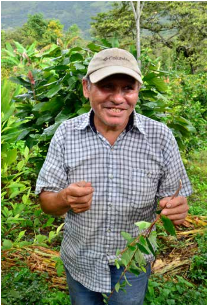
Provincia Cusco/Peru, April 2015. Michael Kleinburger

como ya mencionamos, estaba atravesado por los intereses comerciales del capitalismo mercantil y su necesidad de expansión comercial.