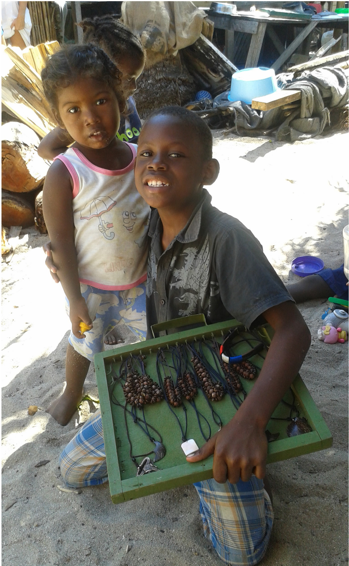
Garifuna Kinder, Chachahuate, Honduras, 2015. Therese Thaler